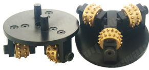
Placa de martelo HTC Bush

Boreway Machinery Co.,Ltd www.fordiamondtools.com www.diamondtools.top