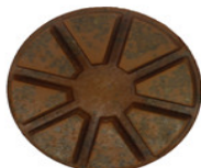
Almofadas de polimento de piso com metal