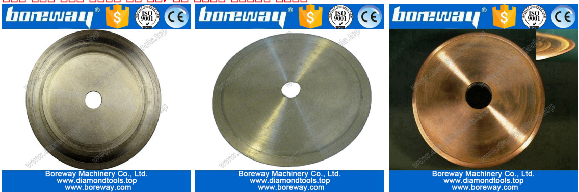
Electroplate jade cutting blade

👉 👉 👉 👉 👉, 👉 👉 👉 👉 👉 👉 👉 👉 👉 👉 👉 👉. 👉 👉 👉 👉 👉 👉 👉 👉, 👉 👉 👉 👉 👉 👉 👉 👉.