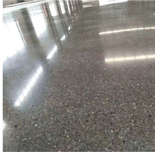
After Grinding and Polishing