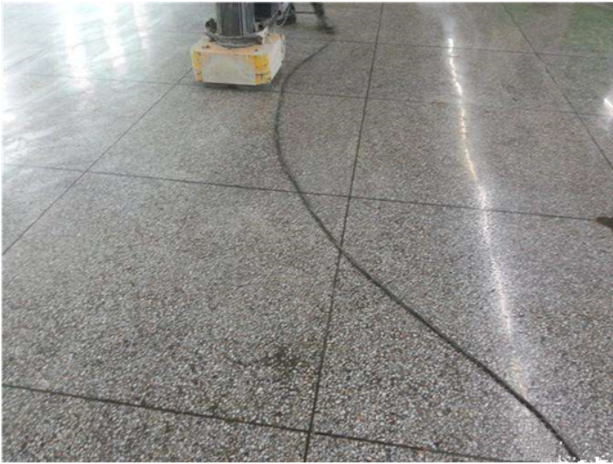
Before Grinding and Polishing