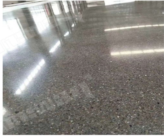
After Grinding and Polishing