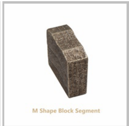
M Shape Block Segment