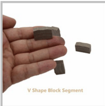
V Shape Block Segment