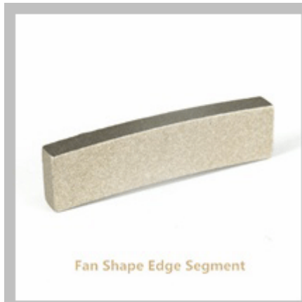
Fan Shape Edge Segment