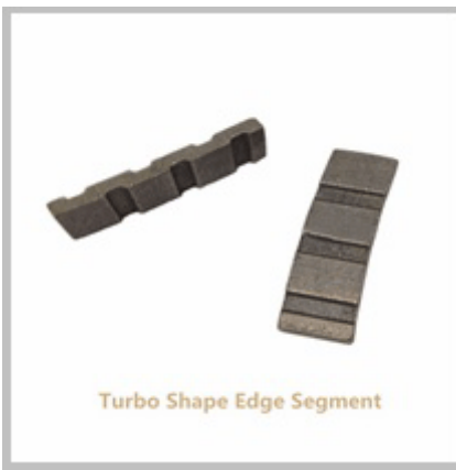
Turbo Shape Edge Segment