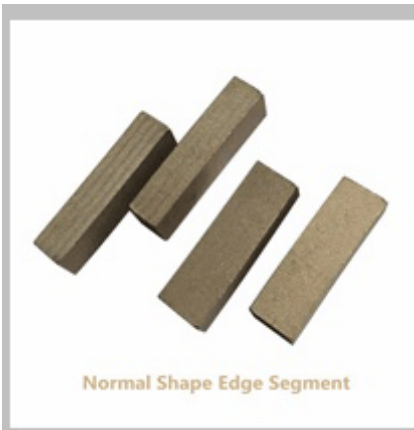
Normal Shape Edge Segment