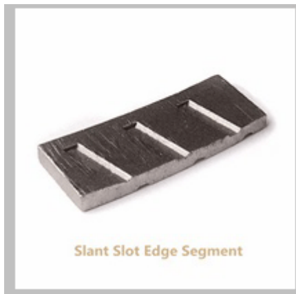
Slant Slot Edge Segment