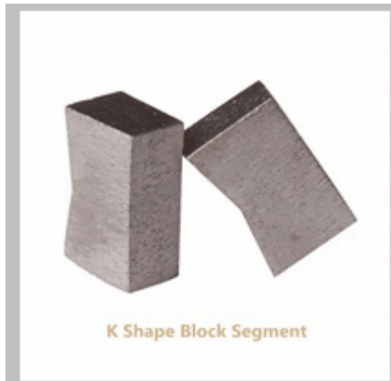
K Shape Block Segment