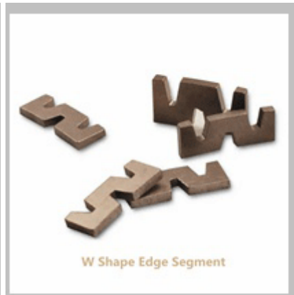
W Shape Edge Segment