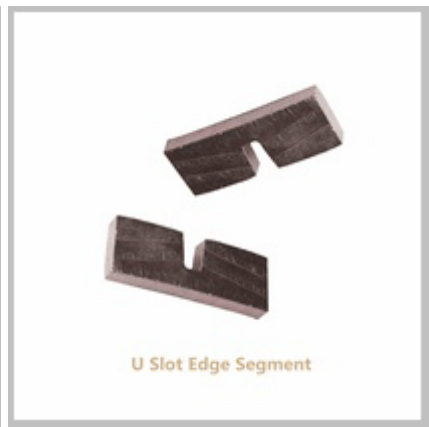
U Slot Edge Segment