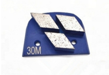
Boreway Machinery Co.,Ltd www.diamondtools.top www.boreway.net