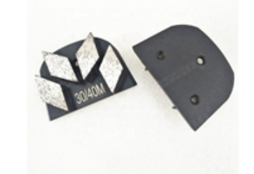
Boreway Machinery Co.,Ltd www.diamondtools.top www.boreway.net