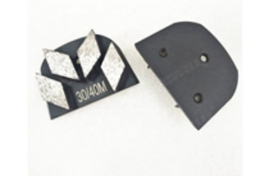
Boreway Machinery Co.,Ltd www.diamondtools.top www.boreway.net