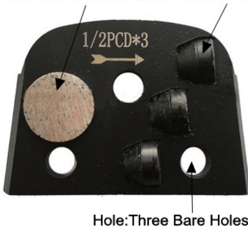
Segment Shape: One Round Segment And Three Half PCD

Lavina □□□□□ 1 □□ □□□ □□□□ □□□ 3 □□ □□ PCD □□□□□ □□□□□ □□ :