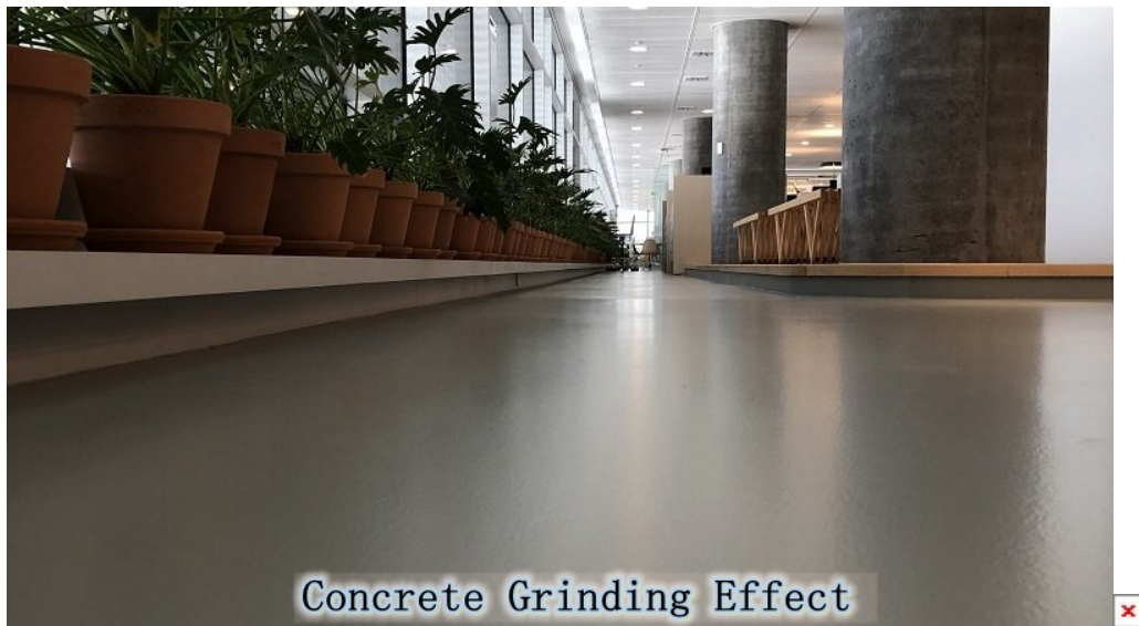
Concrete Grinding Effect