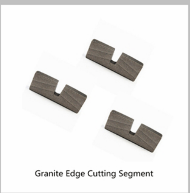
Granite Edge Cutting Segment