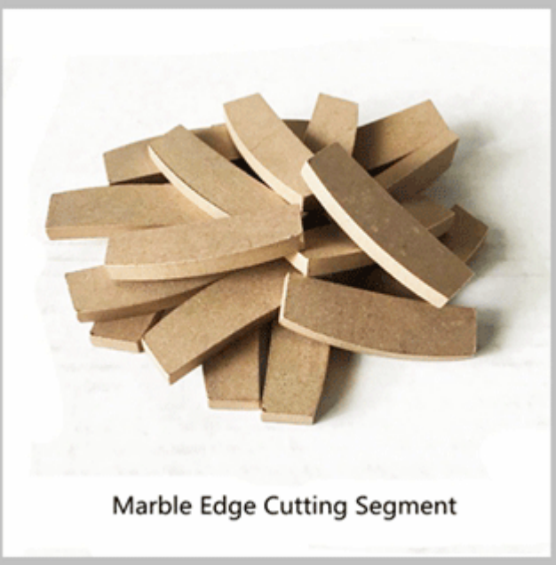
Marble Edge Cutting Segment