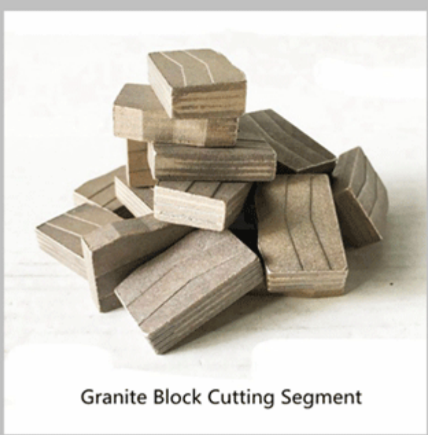
Granite Block Cutting Segment