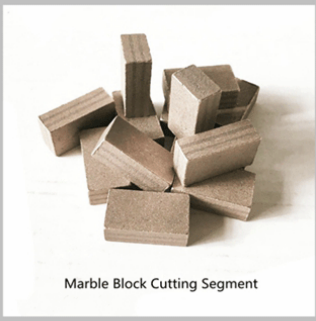
Marble Block Cutting Segment