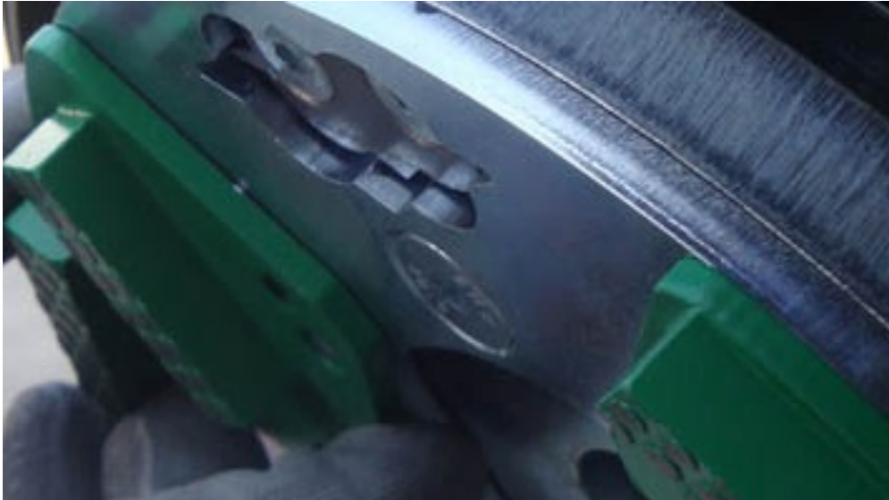
Connection Type:Polar Magnetic System; 6-Hole System