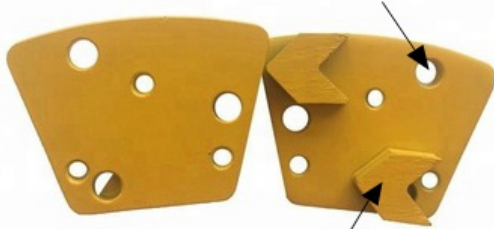
Arrow Segment size: H8mm (H10mm, H12mm also can be customized)