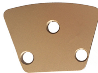
3 X Bare Holes