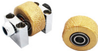
Safe And Non-Slip Effect On Natural Stone Slab