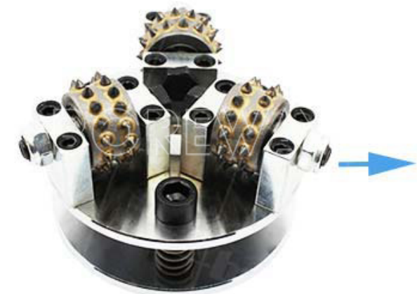
Carbide Alloy Bush Hammer Plate

□□□, □□□ □□ □□ □□□ □□□□□□ □□□ □□ □□ □□□□