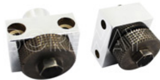
Large Number Of Grinding Squares