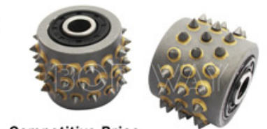
Competitive Price & Superior Quality