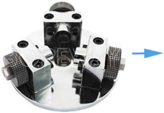
Hundred Teeth Bush Hammer Plate