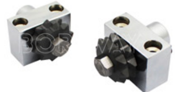
Rich Styles Bush Hammer Plate