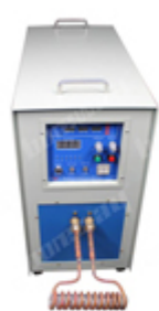
Three Phase 380V 30kW High Frequency Induction Welding Machine