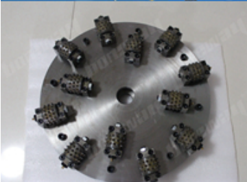
Boreway Machinery Co., Ltd www.diamondtools.top www.boreway.com