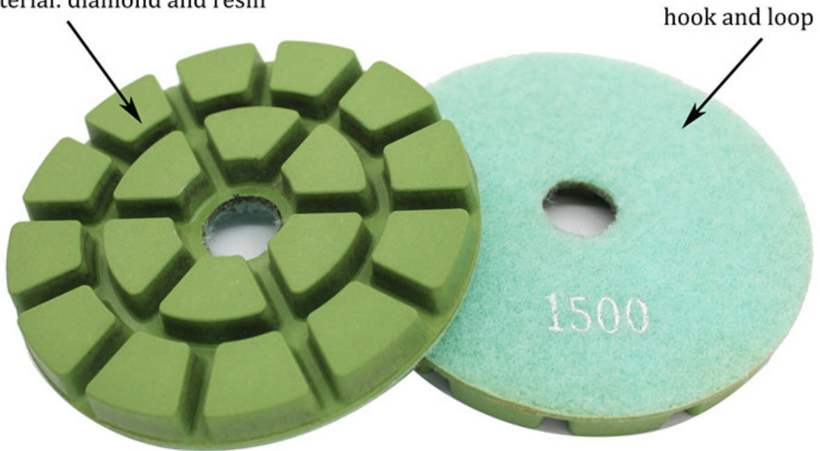
floor renew diamond polishing pads

□□□ □□□□□□ 7 □□ □□ □□ □□□□□□ □□ □□ material: diamond and resin