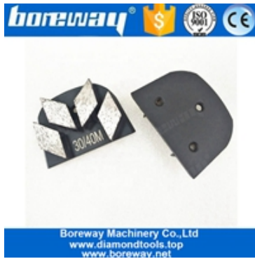
請將您的產品名稱、規格、數量、用途、等詳細說明：