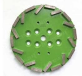
Boreway Machinery Co.,Ltd www.diamondtools.top www.boreway.net