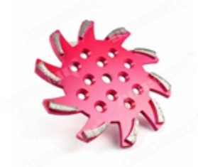
Boreway Machinery Co.,Ltd www.diamondtools.top www.boreway.net