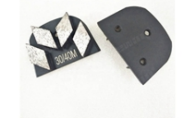
Boreway Machinery Co.,Ltd www.diamondtools.top www.boreway.net