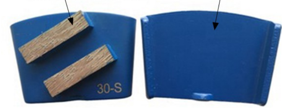
Connection Type: HTC Type

HTC Grinding Pads are used for grinding and polishing of various materials. They are available in different sizes and shapes to meet specific requirements. The HTC type is known for its high efficiency and long life.