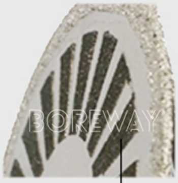
Electroplating Protective Strip