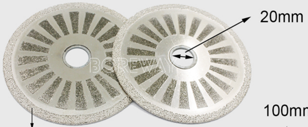
Vacuum Brazed Protection Strip