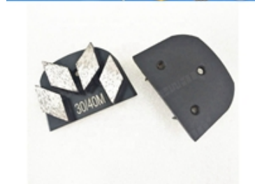
Boreway Machinery Co.,Ltd www.diamondtools.top www.boreway.net