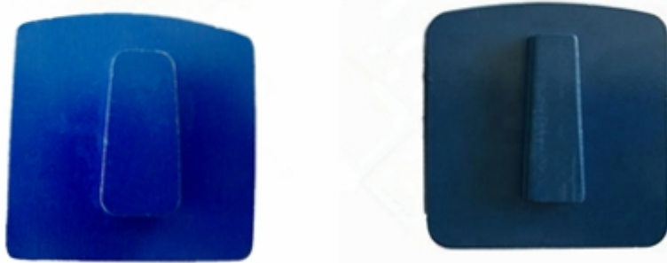
Husqvarna Redi Lock Blank Scanmaskin Blank

2 Redi Lock Redi Scanmaskin Scanmaskin Redi Lock Scanmaskin