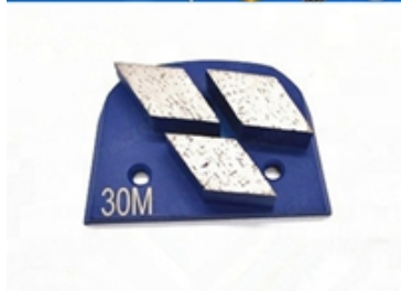
Boreway Machinery Co.,Ltd www.diamondtools.top www.boreway.net