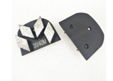
Boreway Machinery Co., Ltd www.diamondtools.top www.boreway.net