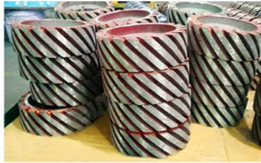
Diamond Satellite Wheel/ Rollers