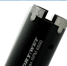
Diamond construction drill bit

Boreway Machinery Co., Ltd. www.diamondtools.top www.boreway.com