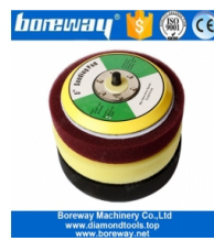
Fondello in schiuma da 5 pollici