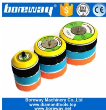
5/16 "-24 Backer Pad