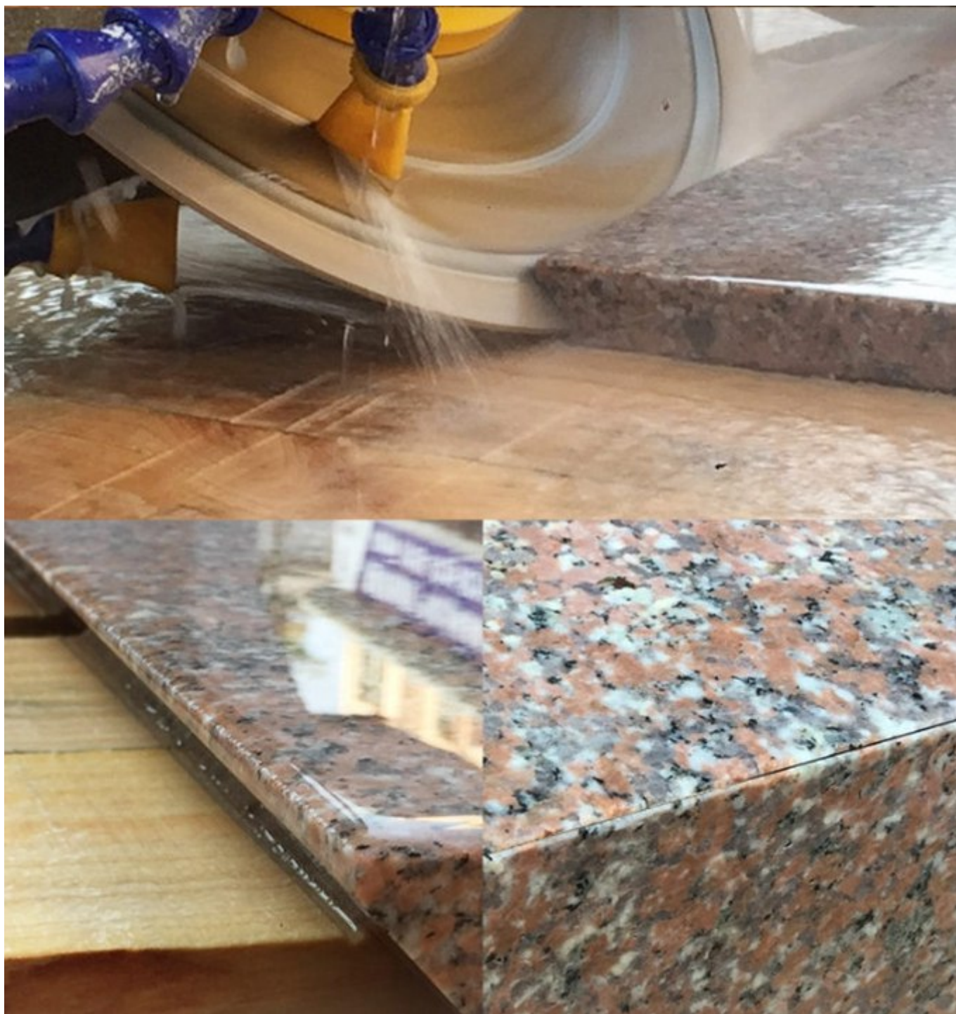
Cina Segmenti diamantati per il taglio di marmo produttore , Effetto di taglio del segmento della lama di pietra: