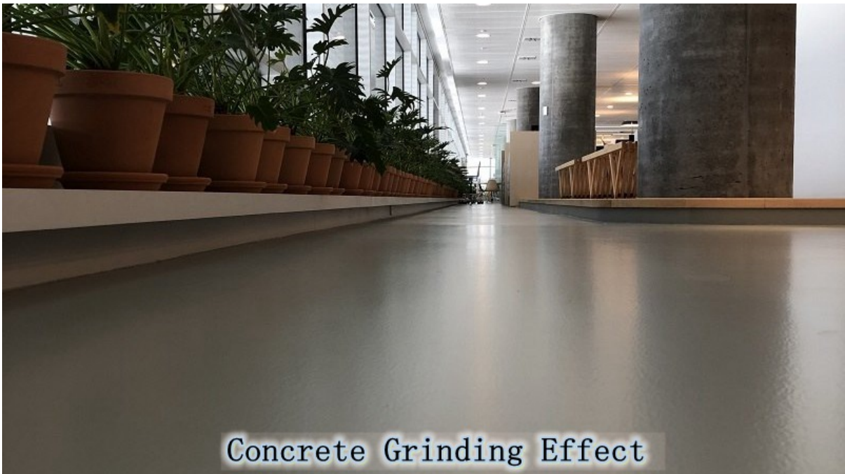
Concrete Grinding Effect