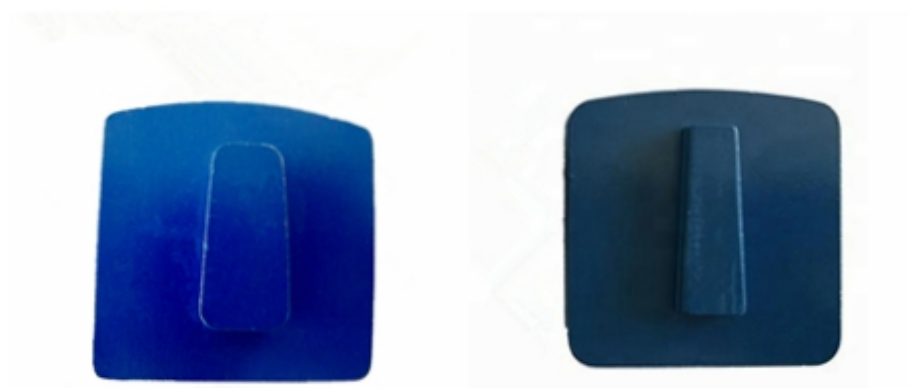
Husqvarna Redi Lock Blank Scanmaskin Blank

ScanMaskin Redi Blocco Blank, perfetto in forma nella rettificatrice scanmaskin.