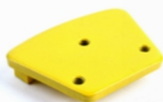
3 X M6/M8 Thread Holes