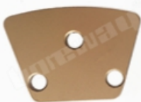
3 X Bare Holes