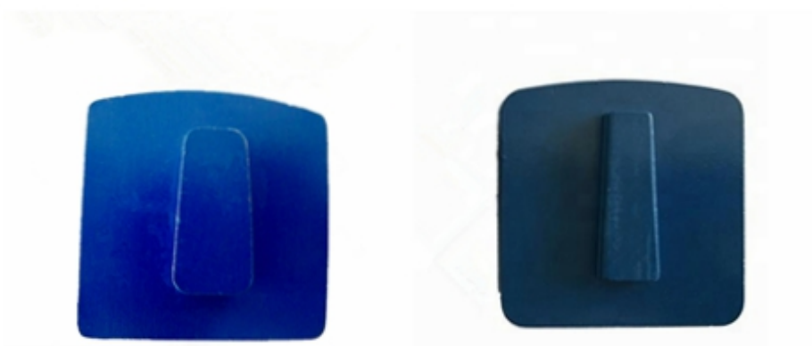
Husqvarna Redi Lock Blank Scanmaskin Blank