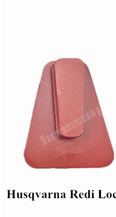
Husqvarna Redi Lock Blank