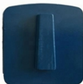
Husqvarna Redi Lock Blank Scanmaskin Blank