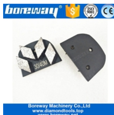
Scarpe abrasive a quattro segmenti