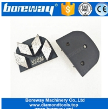
Scarpe abrasive a quattro segmenti