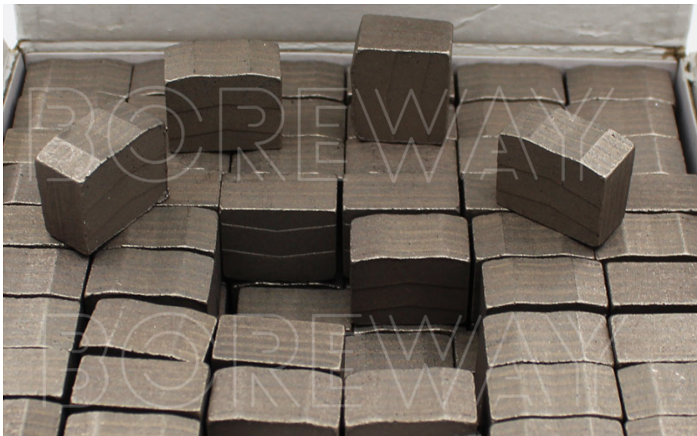
Mostra di fabbrica