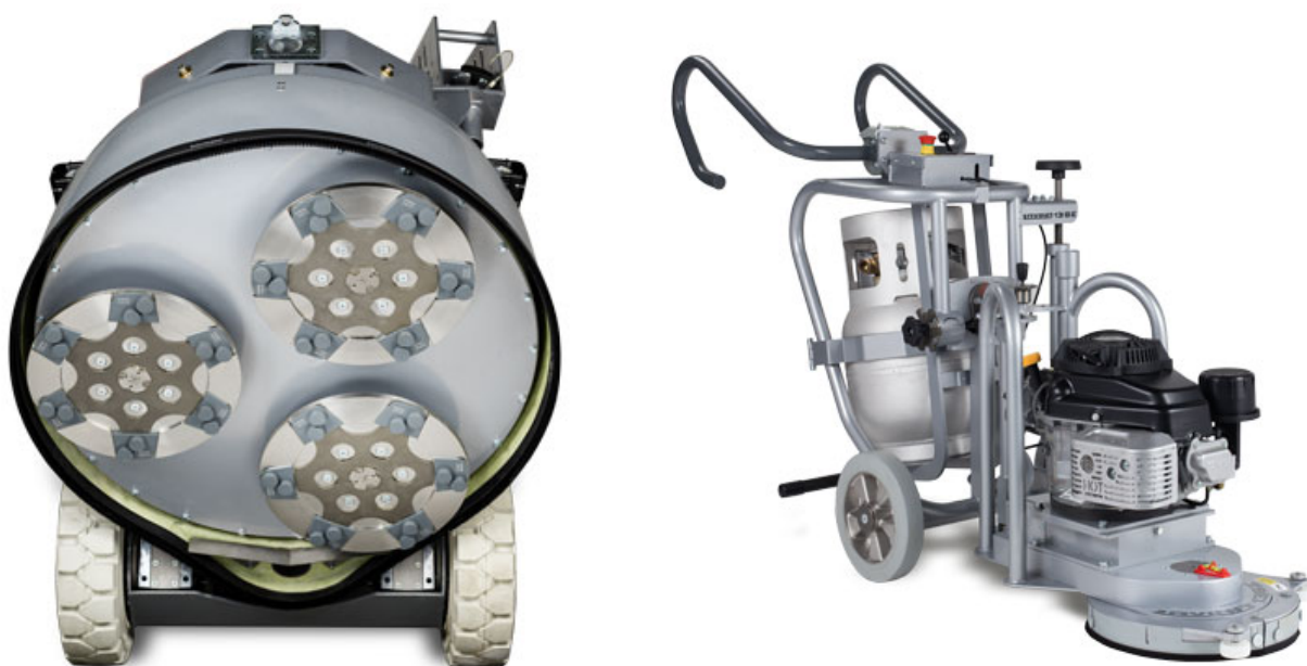
Utensili diamantati Lavina con due segmenti circolari in PCD e due barre sacrificali

Le scarpe abrasive sono progettate per la levigatura e la lucidatura di pavimenti in cemento. Gli stivali / torte sono dotati di bond morbido, bond rigido e standard medio e grana mista. Queste scarpe per la rettifica di diamanti in cemento si adattano al pezzo di stile a cambio rapido e alle teste di lucidatura. Le scarpe da rettifica sono progettate per una durata maggiore rispetto alla concorrenza con un segmento di dimensioni enormi e un costo di rettifica inferiore per metro quadrato.