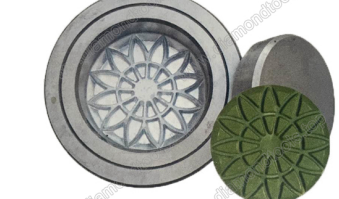
Mould for diamond floor grinding pads

Boreway Machinery Co., Ltd. www.diamondtools.top www.boreway.com