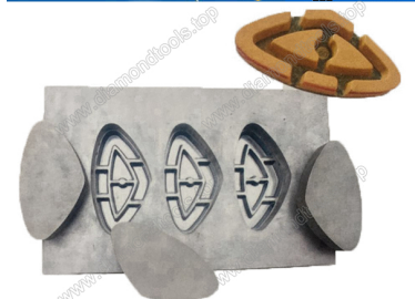
Mould for diamond floor grinding pads

Boreway Machinery Co., Ltd. www.diamondtools.top www.boreway.com