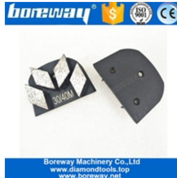
Scarpe abrasive a quattro segmenti