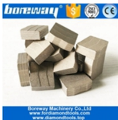
Segmento di taglio del blocco di granito