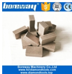
Segmento di taglio del blocco di marmo