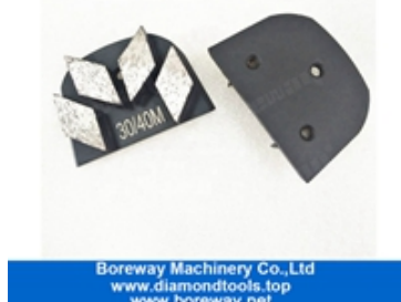
Scarpe abrasive a quattro segmenti