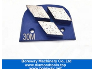
Mole abrasive a tre segmenti