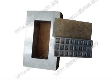
Boreway Machinery Co., Ltd. www.diamondtools.top www.boreway.com Mould for diamond floor grinding blocks