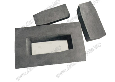
Boreway Machinery Co., Ltd. www.diamondtools.top www.boreway.com Mould for diamond fickert abrasives

Altre specifiche possono essere personalizzati a seconda delle esigenze.