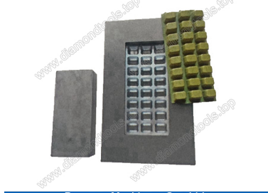
Boreway Machinery Co., Ltd. www.diamondtools.top www.boreway.com Mould for diamond floor grinding blocks