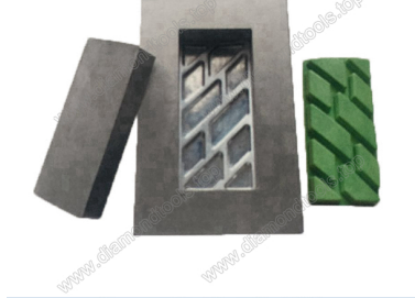
Boreway Machinery Co., Ltd. www.diamondtools.top www.boreway.com Mould for diamond floor grinding blocks