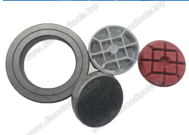
Boreway Machinery Co., Ltd. www.diamondtools.top www.boreway.com Mould for diamond floor grinding pads