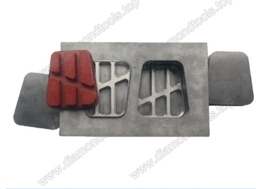
Boreway Machinery Co., Ltd. www.diamondtools.top www.boreway.com Mould for diamond floor grinding blocks