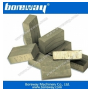
Segmento di taglio a blocchi per marmo