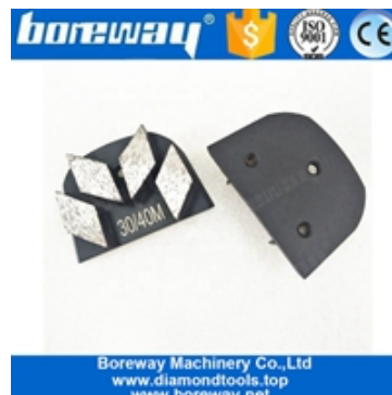
Scarpe abrasive a quattro segmenti