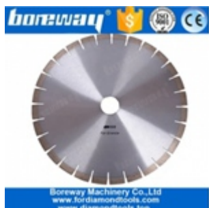
Lama da 14 pollici in granito