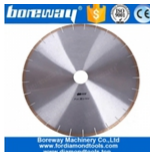
Lama per sega in marmo da 14 pollici