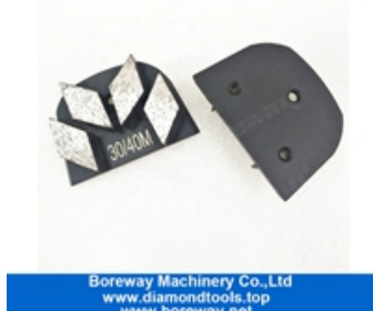
Scarpe abrasive a quattro segmenti