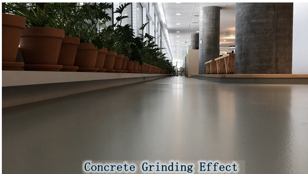
Concrete Grinding Effect