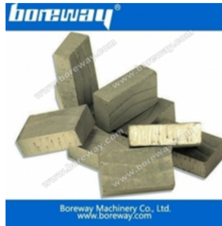
Segmento di taglio a blocchi per marmo