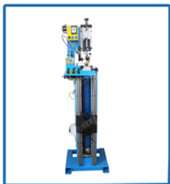
Brazing Machine Welding Rack

notevolmente sulle prestazioni di taglio del segmento di granito.