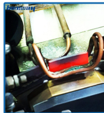
Welding segment effect