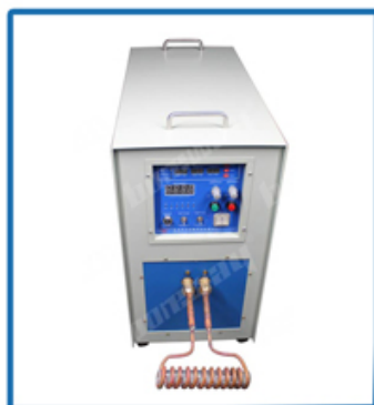
Three Phase 380V 30kW High Frequency Induction Welding Machine