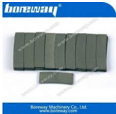
Segmento di taglio dei bordi per granito