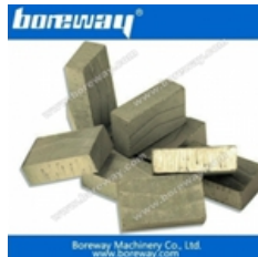
Segmento di taglio a blocchi per marmo